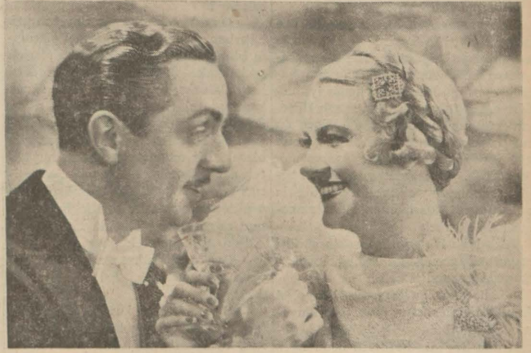
Vilyam Povel ile Bette Davis «Modaçılgınlıkları» filminin bir sahnesinde