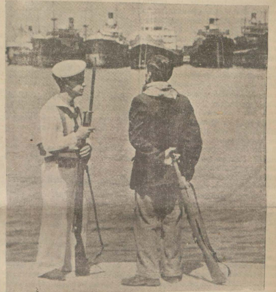
İspanyada hükûmete ait limanlardan birinde, hariçten gelen yük vapurları ile bir bahriyelî ve bir millîs nöbetçi (Yazısı 3 üncü sayfada)

İşe Portekiz de karışıyor, bir Portekiz zırhlısı İspanya gemilerini topa tuttu